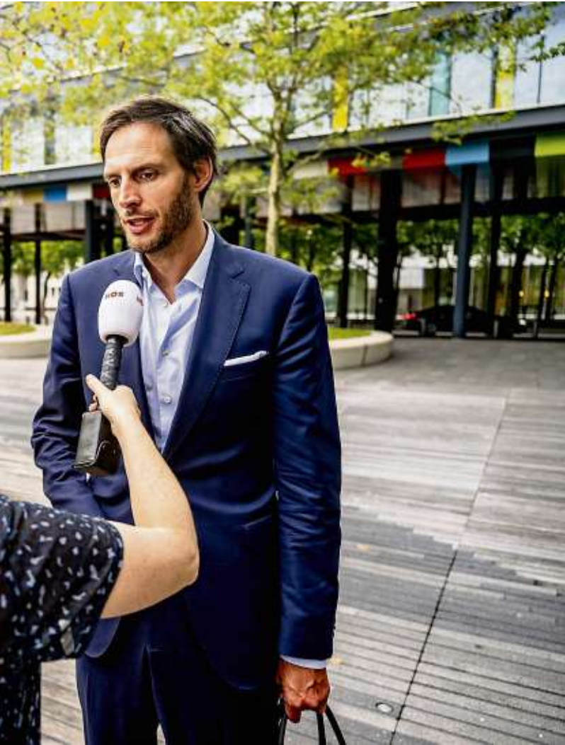
eerste stappen" gezet richting een akkoord over de begroting van volgend jaar, zeggen kopstukken van de coalitie. Donderdag praten ze verder. Of ze verwachten deze week nog tot een akkoord te komen, zeiden de fractieleiders niet.